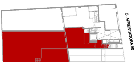
C. APRESTADORA 90